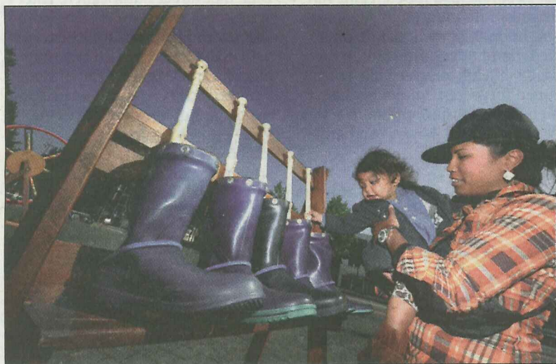
Les Structures Musicales.

glitterjurk van de klatergoudrevue. Deze prachtige, kwetsbare, breekbare en ontroerende voorstelling raakt aan de kern van het menselijk bestaan: daar waar het banale hand in hand gaat met het pure en echt en nep in elkaar overvloeien. Schitterend en onvergetelijk. Gespeeld door oude Belgische travestieten en transseksuelen. Een internationale topproductie die de festivalgangers jammer genoeg links lieten liggen.