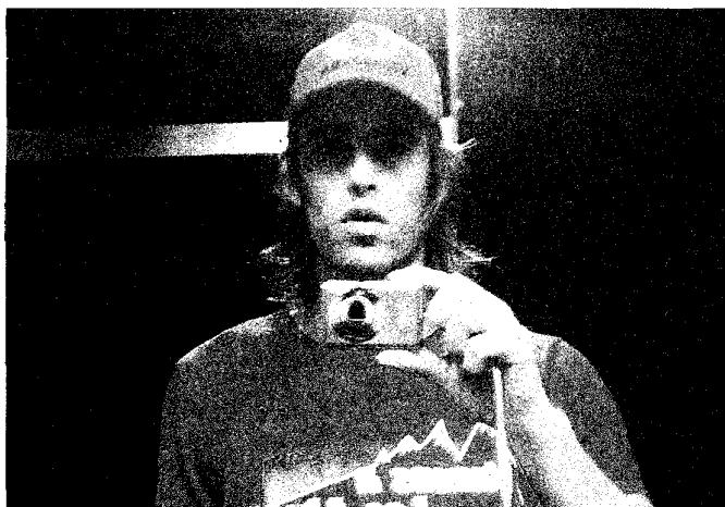
■ Talking about Kevin , het eerste soloproject van Arend Pinoy, is meteen een schot in de roos.