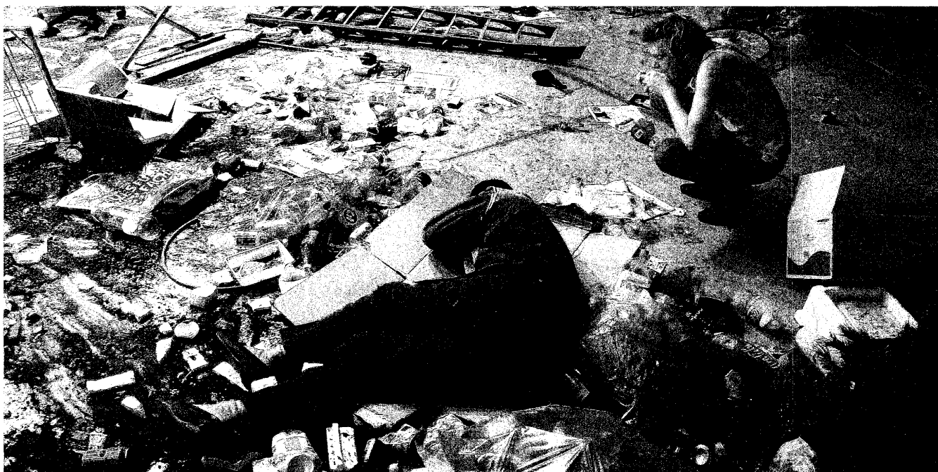
De thuiskomst van het Antwerpse collectief FC Bergman, op locatie in een oude scheepsloods, laat het publiek alle hoeken van het theater zien.

Info over deze voorstellingen op www.theateraanzee.be .