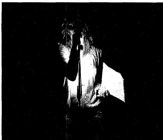
■ Het tempo van Sunday Smile van theater MARS ligt gedurfd laag.